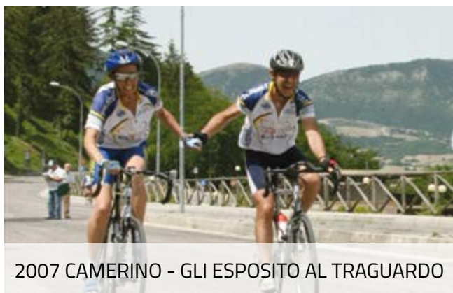
2007 CAMERINO - GLI ESPOSITO AL TRAGUARDO