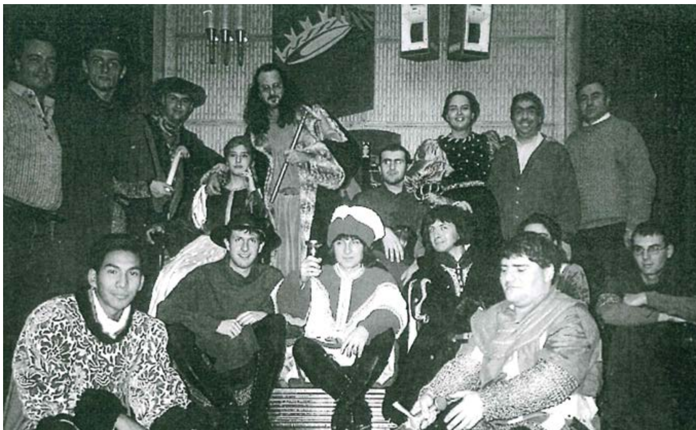
1996 TRIESTE, ANCIU - ASSOCIAZIONE NAZIONALE CIRCOLI ITALIANI UNIVERSITARI

Un gruppo di giovani, molto unito, intraprendente nell'esporsi ed entusiasta nel partecipare a iniziative che per l'ateneo (non lo chiamavamo ancora UNICAM) potevano rappresentare una forte carica promozionale. Penso ad esempio al Festival Arte Elettronica con ognuno di loro impegnato nel funzionamento di evolute apparecchiature informatiche, ad accogliere artisti e ad illustrare ai più scettici (io tra questi!) le potenzialità offerte dalle nuove tecnologie. Al tempo stesso capaci di coinvolgere anche i componenti di altri settori come quelli del Centro Audiovisivi e Stampa cui affidare la preparazione di