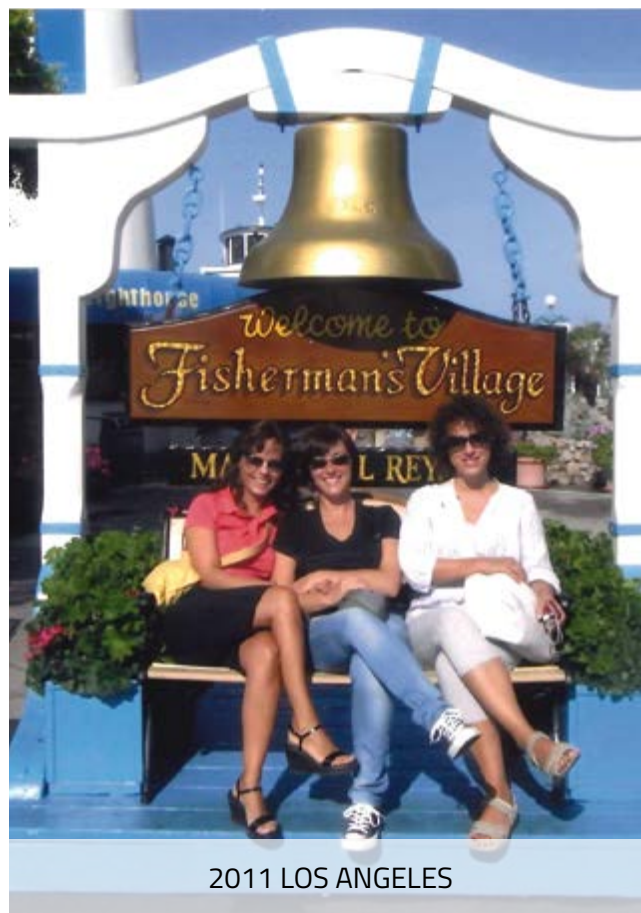
2011 LOS ANGELES

E ancora, le luci, la stravaganza e gli eccessi di Las Vegas, la visita a San Francisco con annessa gita in battello ad Alcatraz, il lusso di Los Angeles nei quartieri di Beverly Hills... si potrebbe continuare per ore, ma il senso di appagamento rimasto in noi per tali esperienze è una conferma implicita del clima sempre positivo vissuto in tali circostanze. Dunque, nel formulare i più sentiti complimenti per le tante iniziative realizzate finora, auguriamo di cuore lunga vita al CURC, e cento di questi giorni!