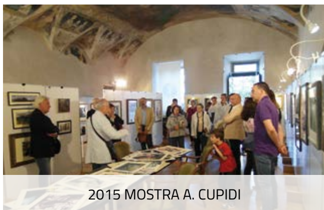
2015 MOSTRA A. CUPIDI