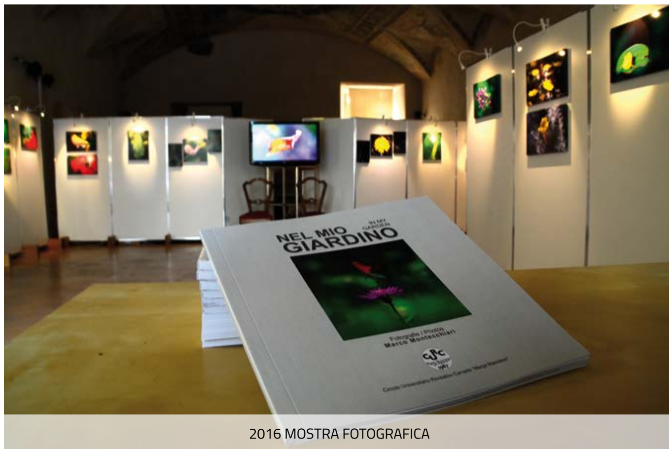
2016 MOSTRA FOTOGRAFICA

Ricorre quest'anno il trentennale della costituzione del Circolo Universitario Ricreativo Camerte, un'associazione fin dalla nascita molto attiva e propositiva ed in grado di catalizzare e convogliare i desideri, gli auspici, lo spirito di iniziativa del personale UNICAM che ne fa parte e che ne ha reso possibile l'esistenza. Tale ricorrenza assume un particolare significato per noi, 'eredi' di uno dei soci fondatori e promotori e convinto sostenitore dell'opportunità di costituire questo Circolo. Da appassionato di calcio, nostro padre sapeva benissimo che la coesione e la compattezza sono elementi