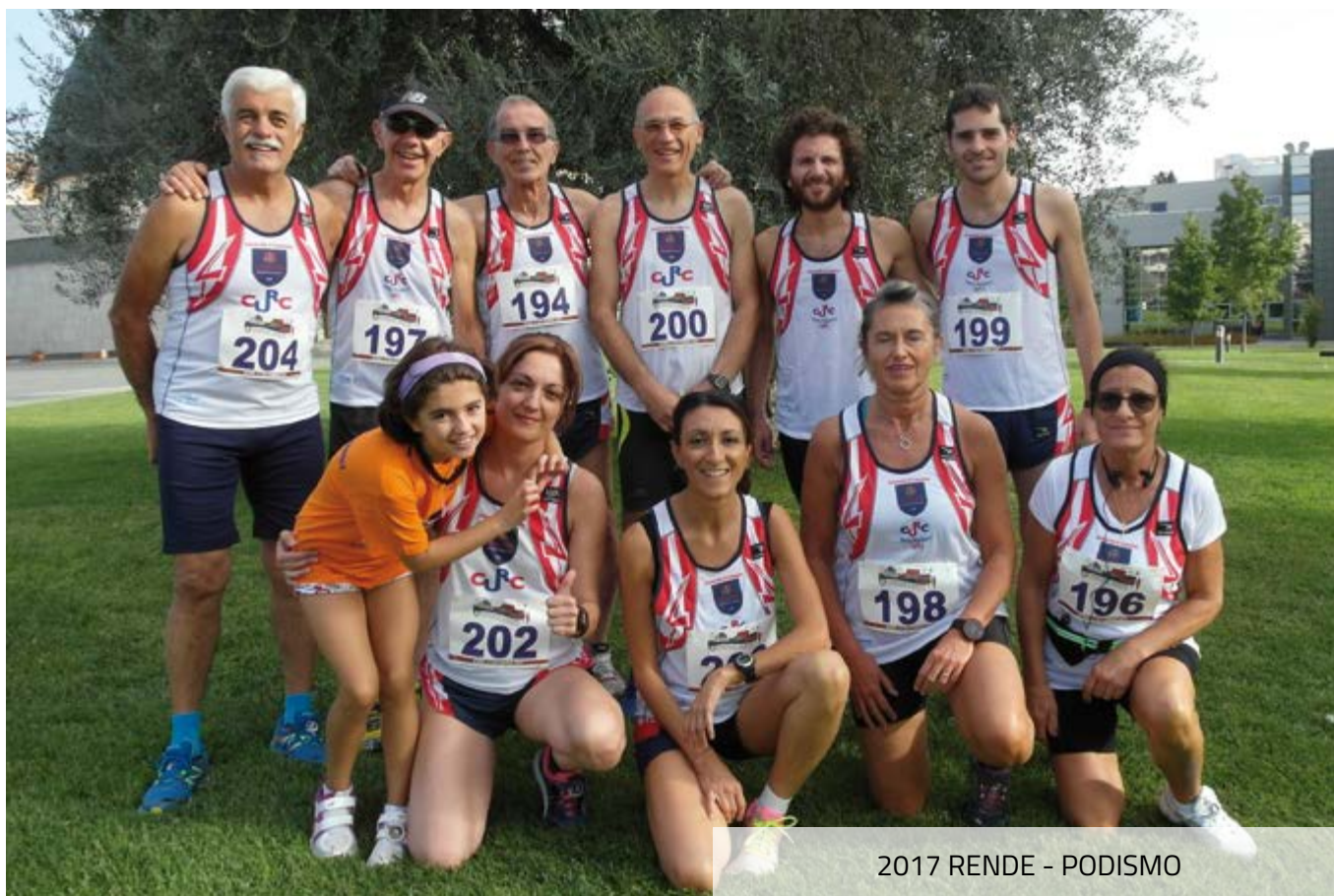
2017 RENDE - PODISMO

Eccellente prestazione dello Squadrone CURC Marga Maiolatesi al 29° Campionato Nazionale Universitario di Podismo dei dipendenti delle Università italiane, svoltosi a Rende domenica 17 settembre, qualificatosi al terzo posto nella classifica degli Atenei, grazie ai molteplici podi conquistati che hanno permesso anche la conquista del 'Premio qualità' assegnato all'Ateneo con la migliore performance calcolando il quoziente tra punteggio totale di ogni squadra ottenuto nella classifica assoluta diviso per il numero di concorrenti giunti al traguardo, per ogni singola squadra. Le premiazioni sono iniziate con un ringraziamento da parte dei colleghi dell'Università della Calabria per la nostra partecipazione nonostante le difficoltà avute con gli eventi sismici dell'anno scorso, donandoci anche una targa con la scritta: 'Agli amici del Circolo Universitario Ricreativo Camerte Marga Maiolatesi che ci hanno onorato della loro presenza manifestando il loro consueto amore per lo sport e l'associazionismo'.