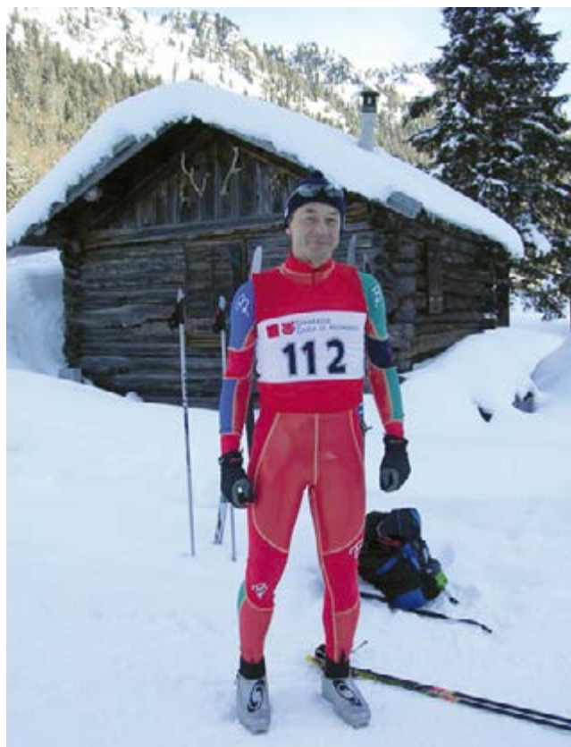
2016 MARCO MATERAZZI