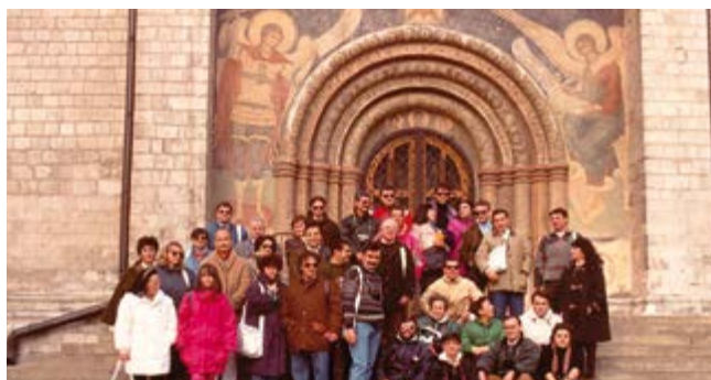
1991 MOSCA - SAN PIETROBURGO