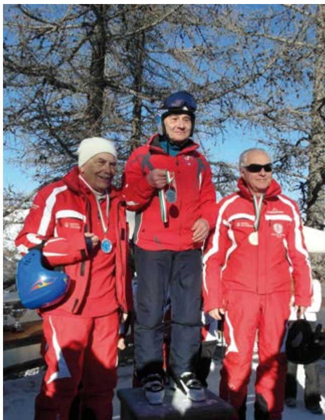
2014 SUL PODIO GIOVANNI MATERAZZI