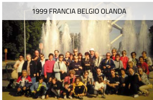
1999 FRANCIA BELGIO OLANDA