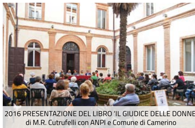
2016 PRESENTAZIONE DEL LIBRO 'IL GIUDICE DELLE DONNE' di M.R. Cutrufelli con ANPI e Comune di Camerino

Partecipare alle attività del Circolo è sempre fonte di arricchimento, che si tratti di gare sportive, attività culturali, assemblee Anciu, si viene sempre in contatto con persone nuove che condividono interessi e ideali, per questo mi auguro che, anche nel futuro, il Curc M.M., continui nelle sue attività e che nuovi colleghi vengano a supportarci!