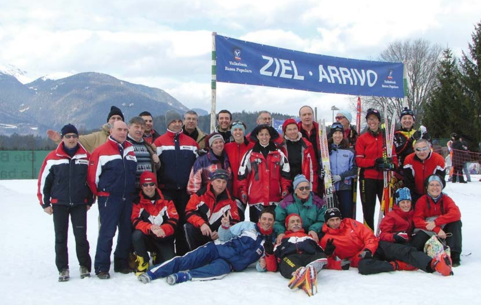
2008 LO SQUADRONE!