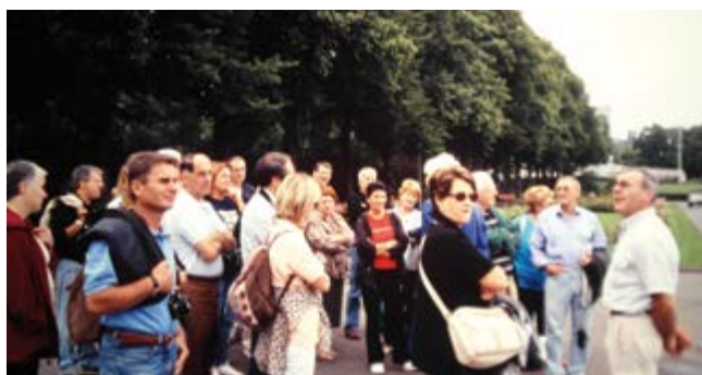
2004 SVEZIA NORVEGIA DANIMARCA