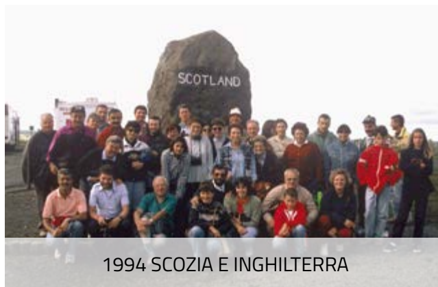
1994 SCOZIA E INGHILTERRA

Eccomi di nuovo a scrivere qualcosa sul nostro Circolo, mentre le mie dita sfogliano le 30 pagine del piccolo ma denso libro realizzato per celebrare i primi dieci anni CURC (1987-1997), stampato dal Centro Audiovisivi e Stampa di allora. Quanta nostalgia!