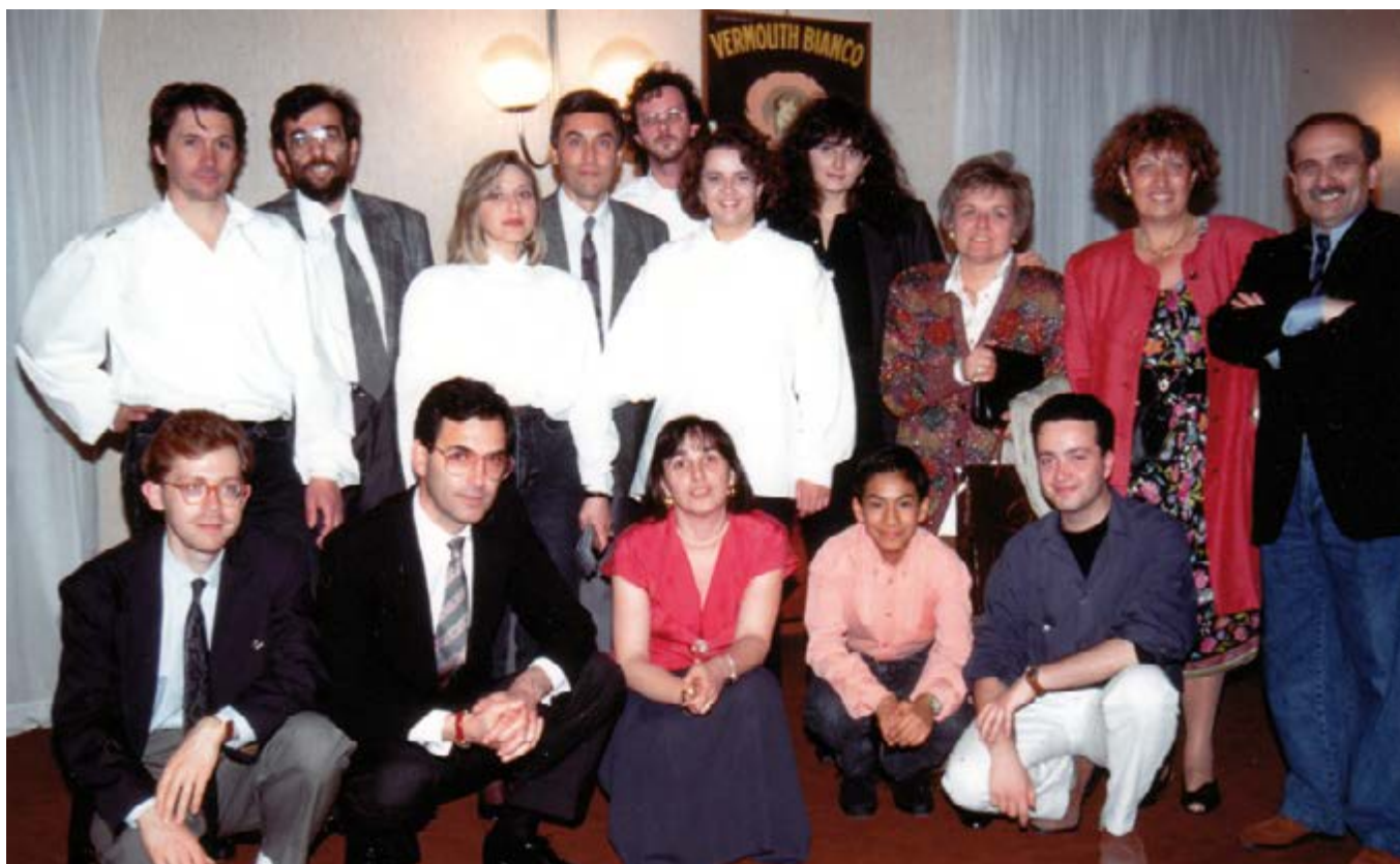
UGO BETTI. LA MEMORIA, LA FIABA, IL MISTERO Concerto per musiche e voci recitanti per il centenario della nascita - Teatro Filippo Marchetti 31 maggio 1992