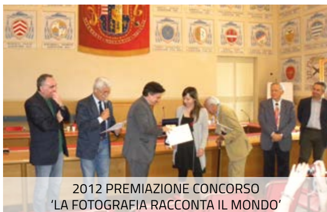
2012 PREMIAZIONE CONCORSO 'LA FOTOGRAFIA RACCONTA IL MONDO'