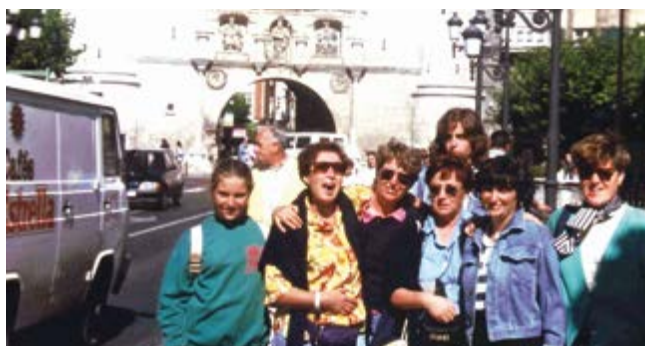
1995 SPAGNA E FRANZIA