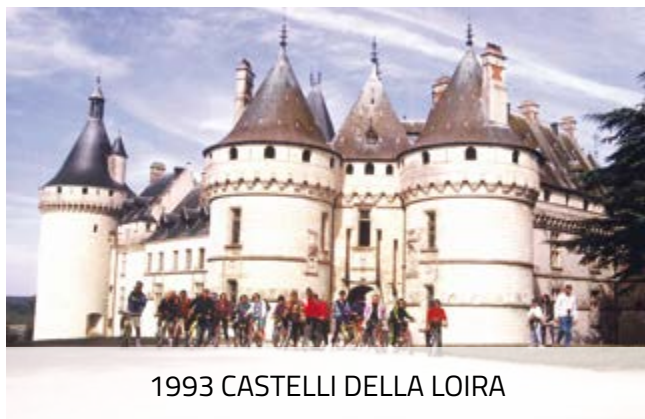
1993 CASTELLI DELLA LOIRA