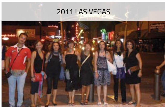
2011 LAS VEGAS