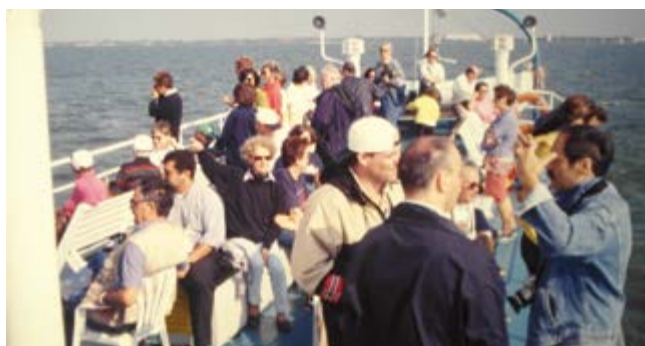
2002 CROAZIA E SLOVENIA